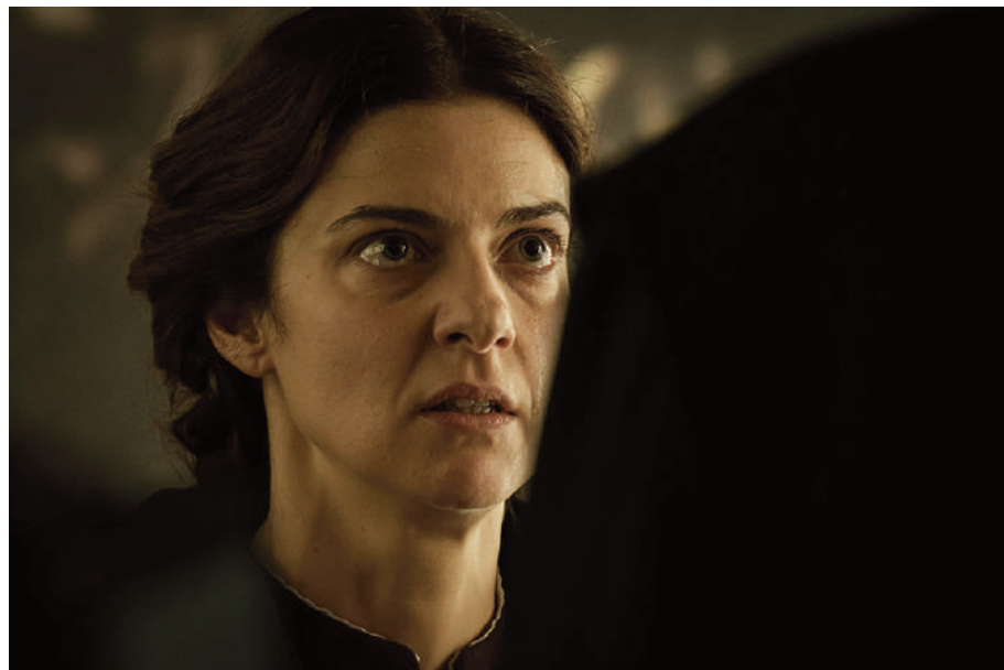
Barbara Ronchi in una scena di Rapito di Marco Bellocchio. L'attrice sarà tra gli ospiti di Io e Federico.

Io e Federico si svolgerà dal 7 al 9 settembre 2023 nel giardino del Palazzo dei Priori