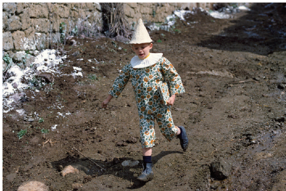
Una delle foto di scena - dal set di Farnese (Vt) de Le avventure di Pinocchio di Luigi Comencini - esposta nella mostra Tuscia, la terra del cinema.