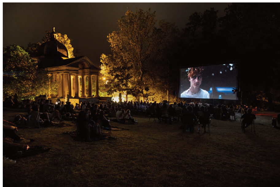
Un momento della proiezione speciale di Bones and all con Luca Guadagnino nell'arena da quattrocento posti allestita nel Sacro Bosco (Parco dei Mostri)

Ai due eventi è stata abbinata la presentazione di eccellenze enogastronomiche del territorio con l'organizzazione di degustazioni e presentazioni a corredo delle due serate.