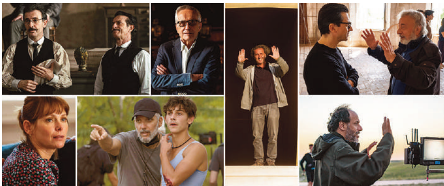
Da Ficarra e Picone a Luca Guadagnino. Il cinema italiano è stato ancora una volta protagonista nella Tuscia per la ventesima edizione del TFF.

Per il ventesimo anno la Tuscia torna a essere la terra del cinema .