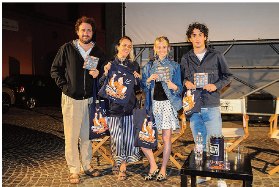
Il regista e il cast del film Non credo in niente, ospiti della due giorni di proiezioni e incontri di Soriano nel Cimino (Vt).

Sono stati coinvolti nella condivisione delle iniziative sviluppate vari soggetti e addetti ai lavori (agenzie, guide e tour operator) provenienti dal circuito non solo locale ma anche nazionale.