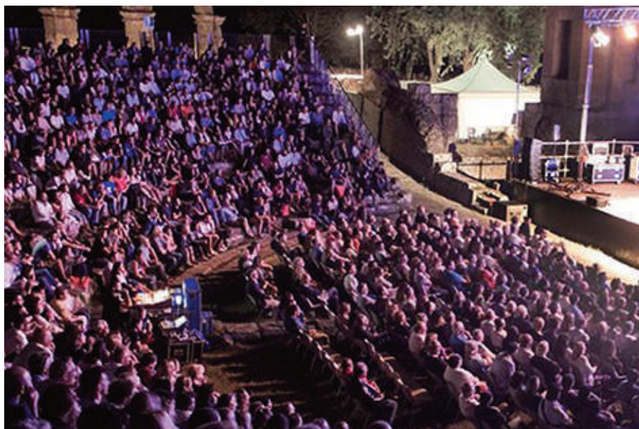
Il teatro romano di Ferento (Viterbo).