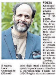
Il regista Luca Guadagnino (52 anni)

il travolgente Chiamami con il tuo nome che regala la statuetta per la sceneggiatura a James Ivory e lascia la carriera di Chalmers, diventato oggi una star e attore in Dune 2 . Oggi l'attore considera Guadagnino un secondo padre» e a proposito del film che verrà presentato domani a Bomarzo ha dichiarato: «È un'occasione oggi non è per niente facile, i social ti espongono al giudizio continuo. Per me è stato un sollievo interpretare un personaggio che combatte con un dilemma interiore senza mai averla cercata il riscontro su Instagram o TikTok».